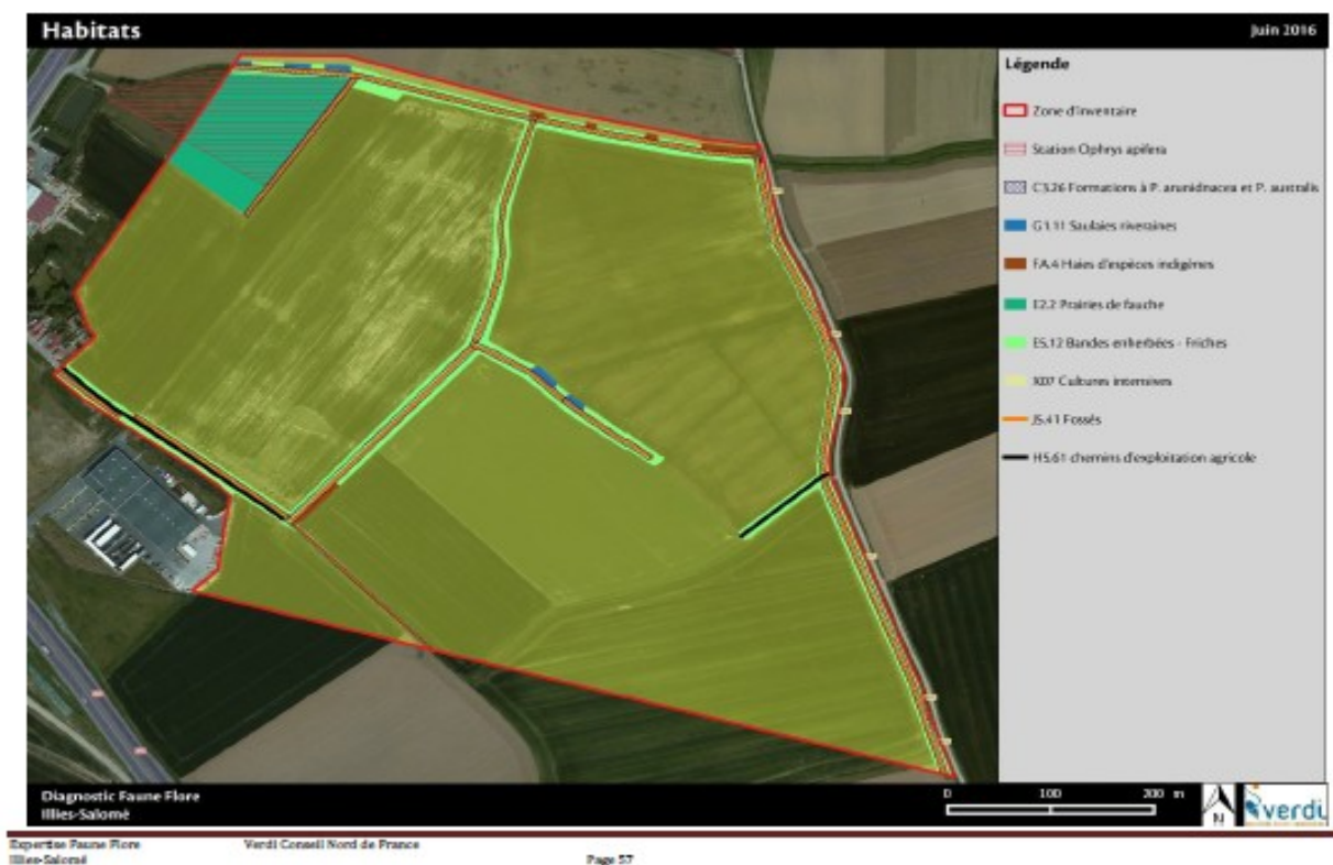
Carte des habitats (p57 du diagnostic écologique)

Le terrain du projet est une parcelle cultivée sur laquelle de fossés avec des bandes enherbées associées, des haies, un bunker de la Seconde Guerre mondiale et une prairie de fauche humide sont présents :